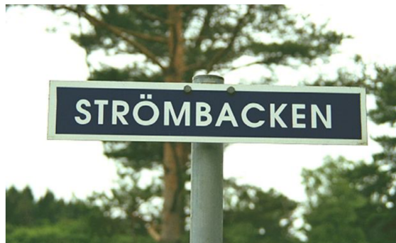
Skylt vid Djupedala vattenkraftverk.