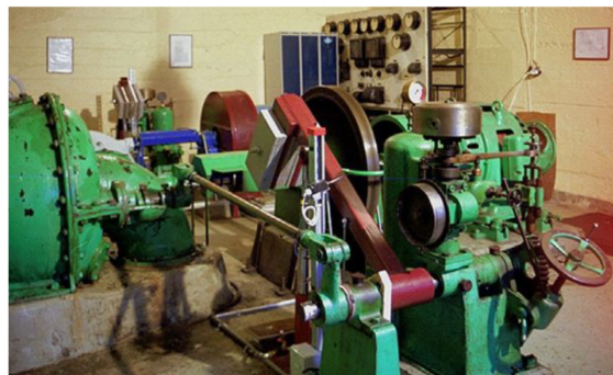
Interiör från Djupedala vattenkraftverk.