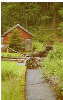
Vattenkanalen vid Djupedala vattenkraftverk.

verkstäder och hus, endast med hjälp av fotogenlampans ljus. På gårdarna fanns inga maskiner och korna mjölkades för hand. Det var en strävsam och arbetsam vardag för de som bodde på landsbygden.