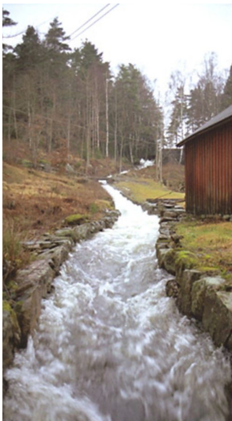
Vattenkanalen vid Djupedala vattenkraftverk.