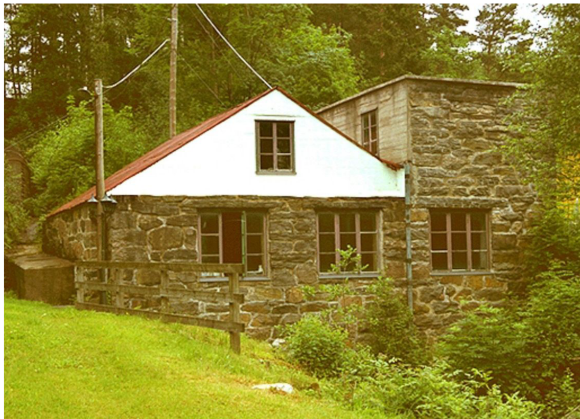
Kraftstationen sedd från sydväst.