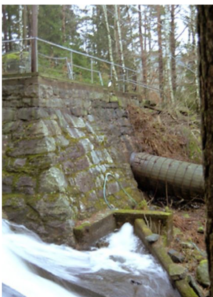
Dämme med vattenränna och tub vid Djupedala vattenkraftverk.