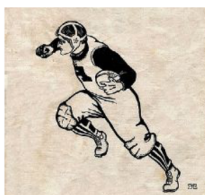
Amerikansk fotboll 1902.

1991: Nio personer kläms ihjäl av folkmassorna på väg in på en basketmatch vid City College of New York.