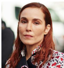
Noomi Rapace.